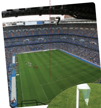
• camp de joc